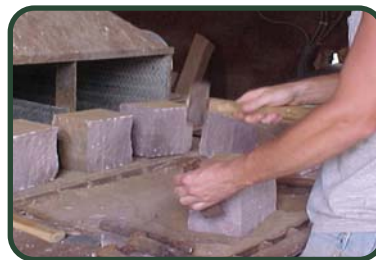
Detalles artesanales agregados a tapas de pared y piezas de base para el proyecto del Cementerio de Veteranos.

Aunque compartimos muchas de las herramientas y procesos utilizado en las otras canteras de la empresa, nuestro trabajo se vuelve muy manual y detallado después del disparo. Esta combinación está en pantalla completa con este proyecto.