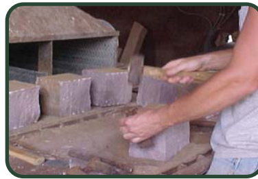
Handcrafted details added to wall caps and base pieces for Veterans Cemetery project.

Although we share many of the tools and processes used at the other quarries in the company, our work becomes very manual and detailed after the shot. This combination is on full display with this project.