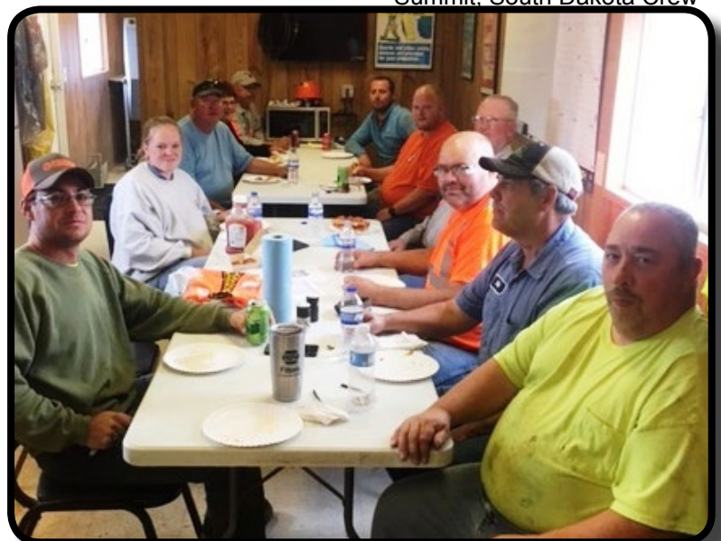
Summit, South Dakota Crew