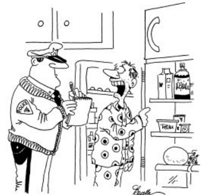
"Did they take anything valuable? The leftover turkey, stuffing, pumpkin pie..."