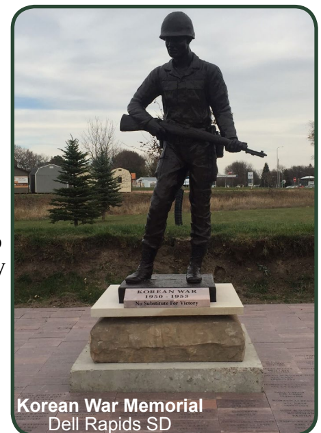
Korean War Memorial Dell Rapids SD