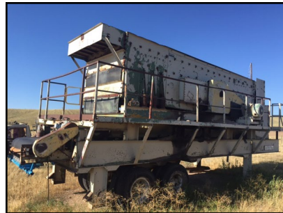
Worn-out Road Base Plant

In Colorado, we like to dream of what's next and are always open to challenges and leaps of faith. For example, earlier this year we found ourselves needing to replace a worn-out track mounted road base plant. We researched and studied what the market had to offer and what our needs were. After all that, we found we had the equipment sitting in the various "Bone" yards around Colorado — plants of the past .